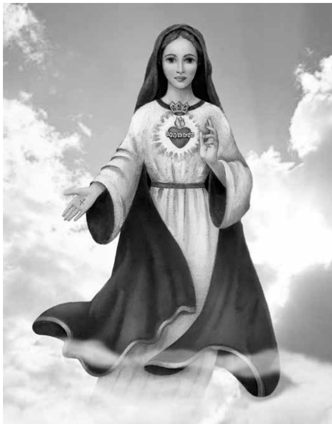
Maria Refugio del Amor Santo